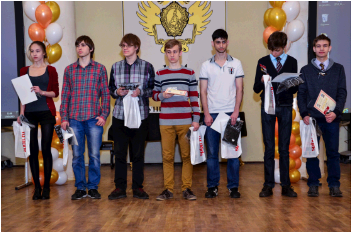
2015 г. Награждение победителей из 11 класса.