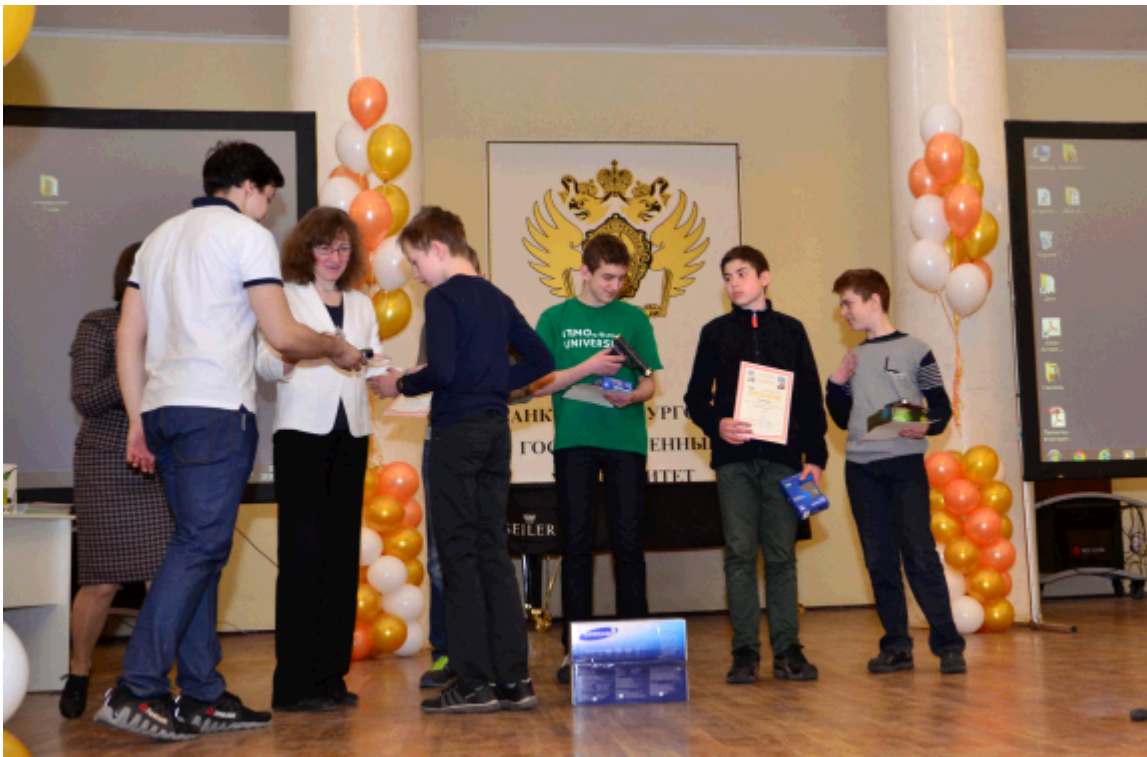
2015 г. Награждение победителей из младших классов.