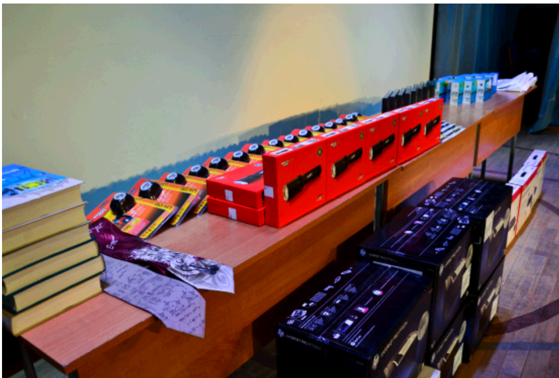
2014 год. Призы для победителей олимпиады, их учителей и школ .