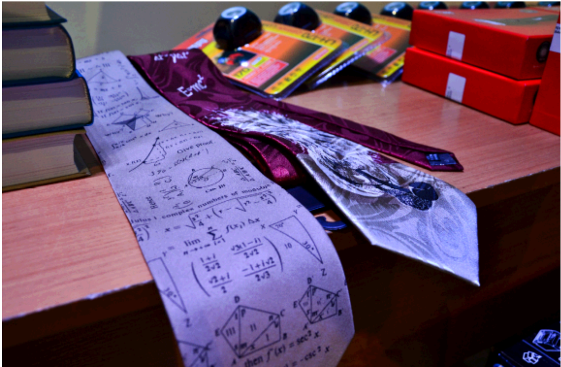
2014 год. «Физико-математические галстуки»