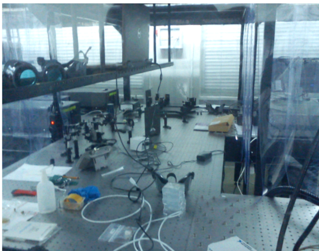
Экскурсия дипломантов олимпиады в научные ресурсные центры СПбГУ