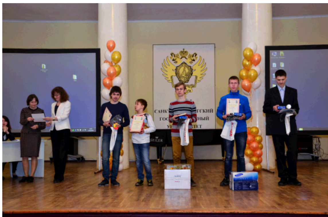
2015 г. Награждение победителей за 10 класс — в том числе восьмиклассник занял абсолютное третье место, обогнав несколько тысяч десятиклассников.