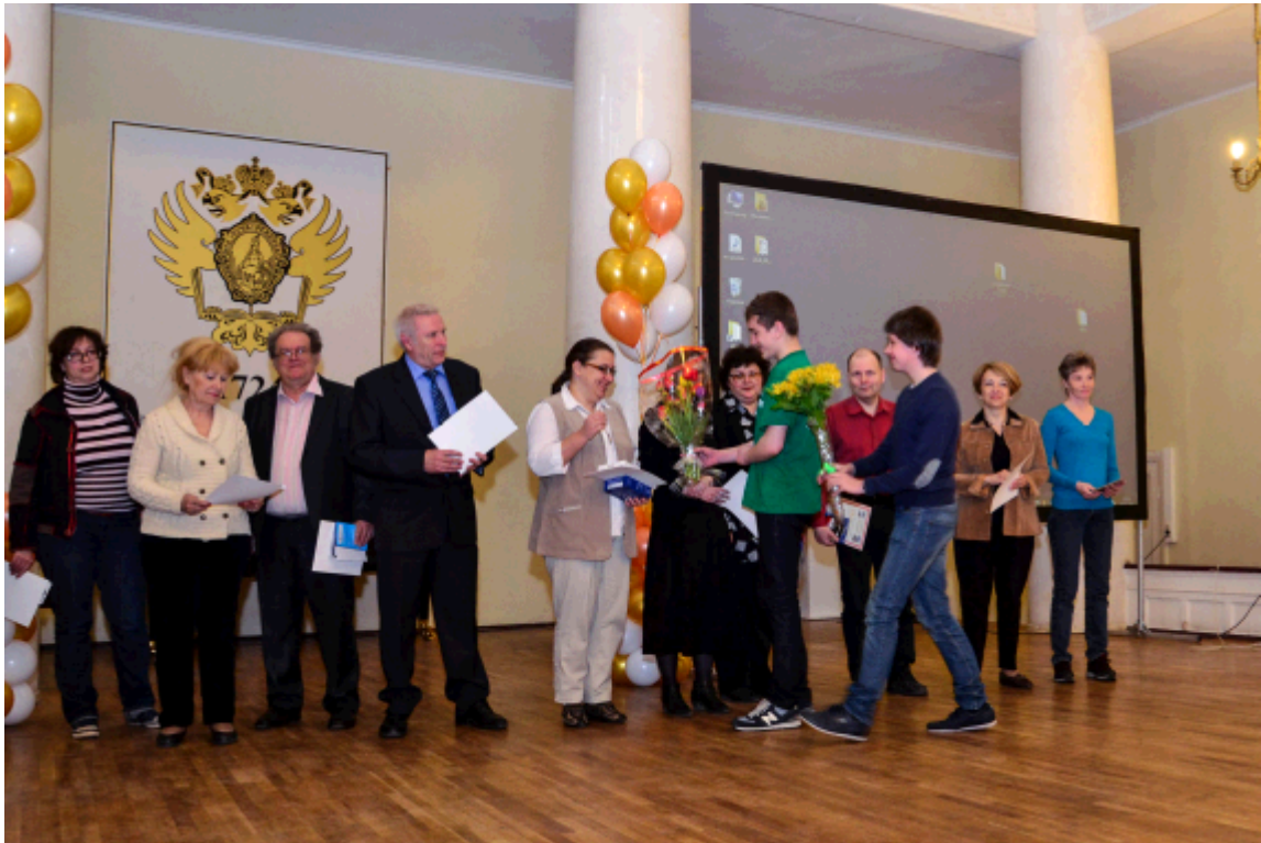
2015 г. Награждение учителей.