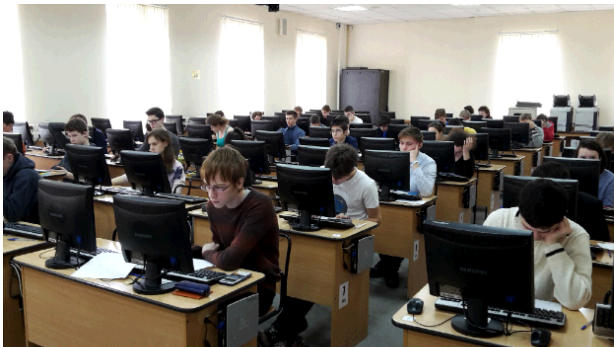
Прохождение очного тура олимпиады в Санкт-Петербурге в 2016 году