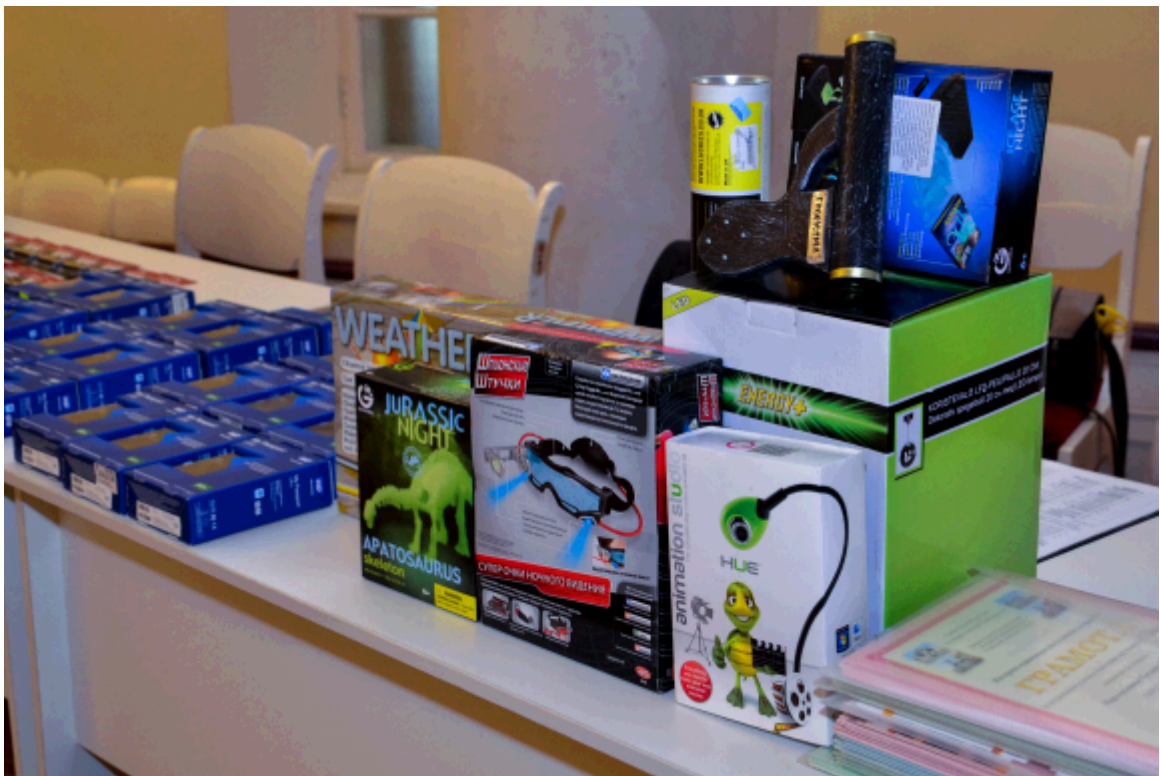
2015 год. Призы для победителей олимпиады, их учителей и школ.