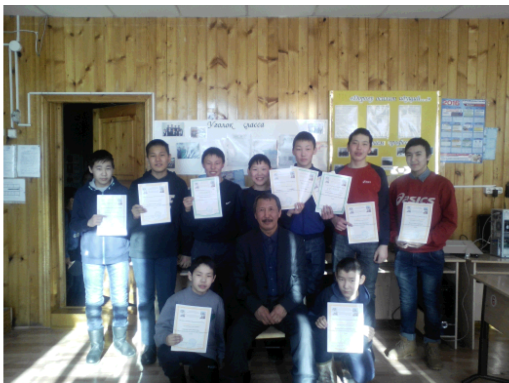
Учащиеся Морукской СОШ (маленькой сельской школы в Сибири) с дипломами олимпиады и их учитель — результаты дистанционного этапа олимпиады 2015/2016 года оказались успешны.