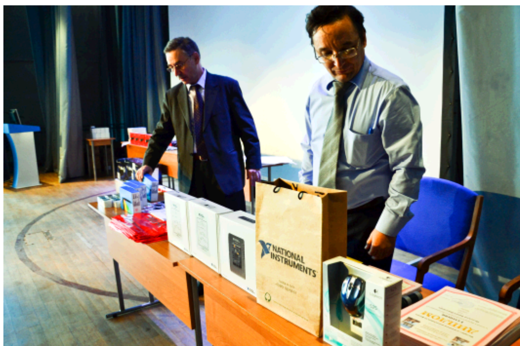
2014 год. Подготовка призов для школ от компании National Instruments – устройств автоматизации физического эксперимента NI myRIO и NI myDAQ и лицензий на программную среду разработки программного обеспечения автоматизации физического эксперимента LabView , а также призов для школьников - iPod и лицензий на LabView.