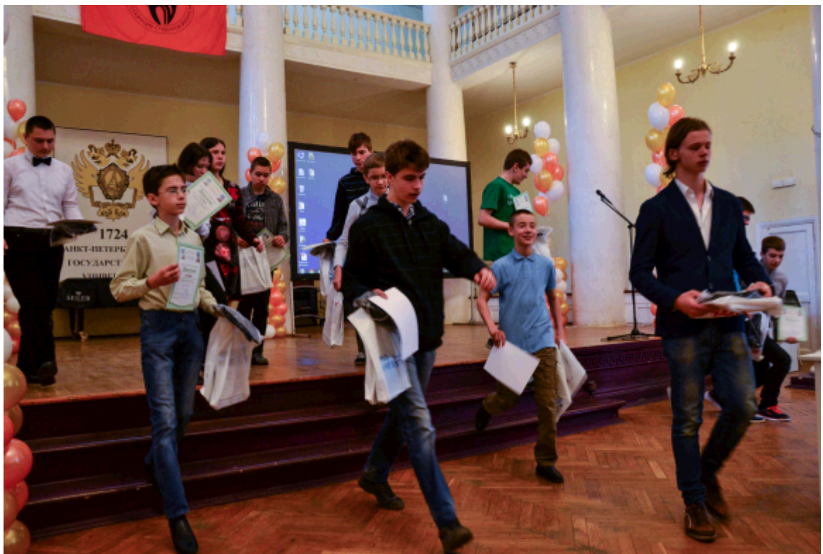
2015 г. С дипломами и призами — к новым победам!