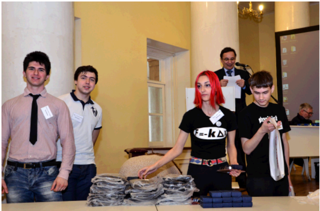
2015 г. Студенты-физики, которые сами пару лет назад были участниками интернет-олимпиады, помогают награждать дипломантов.